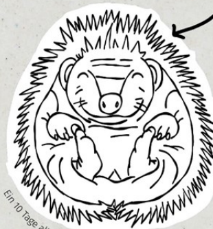
Ein 10 Tage altes Igelbaby.